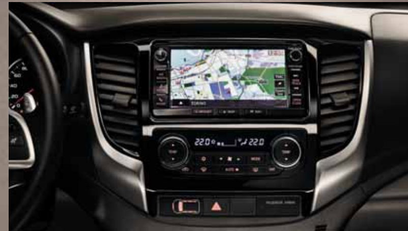
МНОГОФУНКЦИОНАЛЬНАЯ АВТОМАГНИТОЛА С СЕНСОРНЫМ ДИСПЛЕЕМ И УПРАВЛЕНИЕМ НА РУЛЕ.