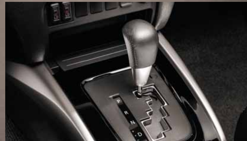
АВТОМАТИЧЕСКАЯ КОРОБКА ПЕРЕДАЧ.