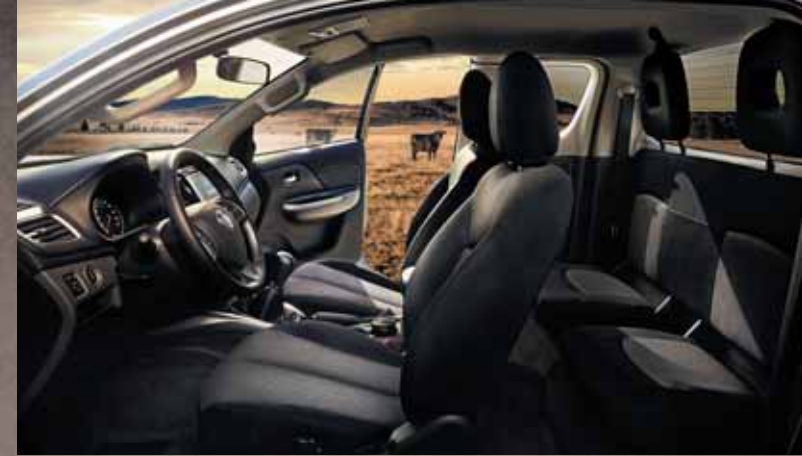
ИНТЕРЬЕР С ОТДЕЛКОЙ ИЗ ТКАНИ.